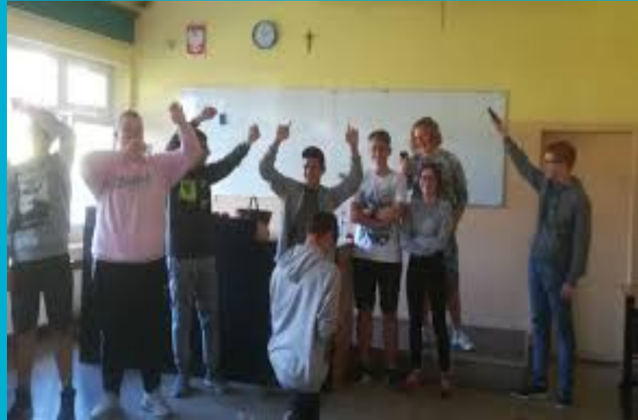
Klasa okazuję się być fajna