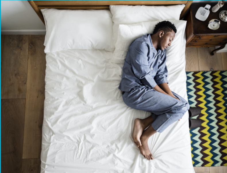
Przemyślenia na temat klasy